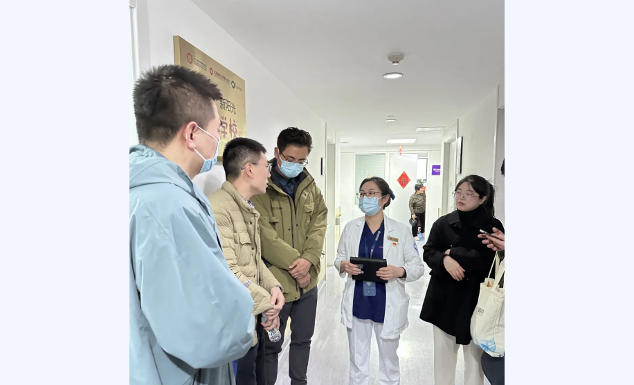
参观“儿童医疗辅导”志愿服务团队开设爱佑童乐园

通过本次活动的互相交流学习，分享彼此的经验和见解，未来的道路，我们将更加努力，沿着医院优质服务的道路，把工作做到更好、更出色。让“青年文明号”放射更加璀璨的光芒！